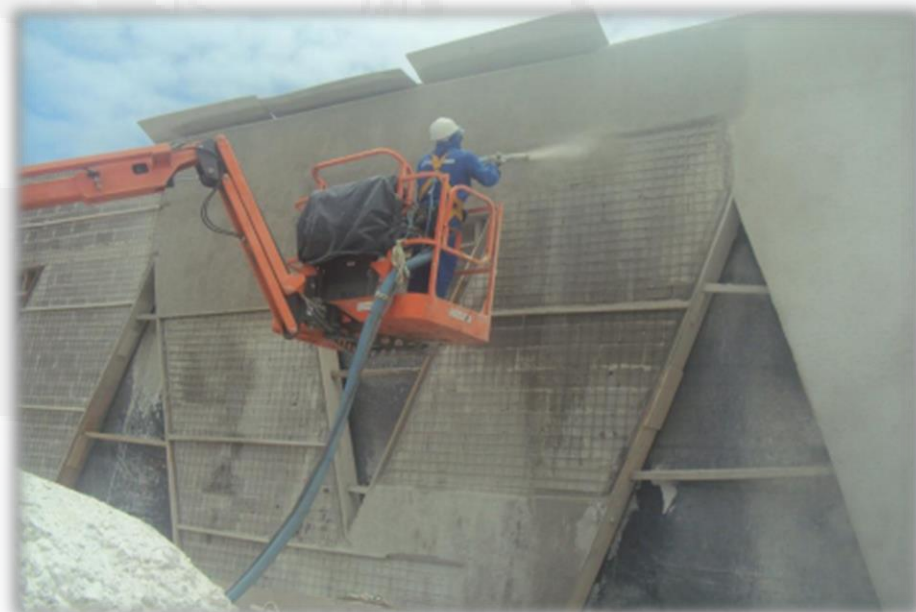
CONCRETO PROJETADO VIA SECA

CLIENTE: CONSTRUTORA OAS LOCAL: TÚNEL DE LIGAÇÃO DA VIA EXPRESSA, SALVADOR-BA.