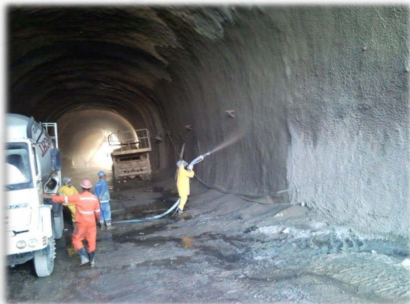
CONCRETO PROJETADO VIA ÚMIDA

CLIENTE: CONSTRUTORA OAS LOCAL: TÚNEL DE LIGAÇÃO DA VIA EXPRESSA, SALVADOR-BA.